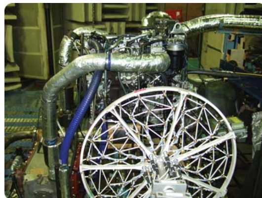
Fig. 3 いすゞの音質マッピング用機材の中の PULSE フロントエンド

広い周波数範囲をカバーするために、ビームフォーミングと SONAH の両方を使用しました。ビームフォーミングは高周波の、SONAH は低周波の音源同定に用いられます。すべての測定には、直径 0.5m、84 チャンネルのセクターホイールアレイを用いました。「システムをセットアップして 3 面について測定し、プリュエル・ケアーの PULSE ソフトウェアでデータを処理するのに必要だった時間は、ほぼ 1 日でした。」と齋藤氏は語っています。測定ではアイドル状態から最高回転数までの加減速試験と、定常試験の両方が行われました。