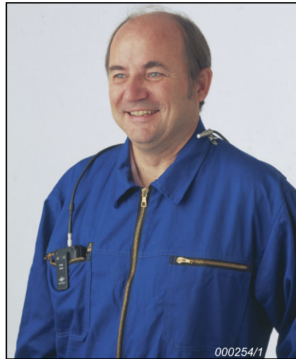
Fig. 1 El micrófono incorpora una pinza para la solapa y el dosímetro se puede llevar en el bolsillo superior.