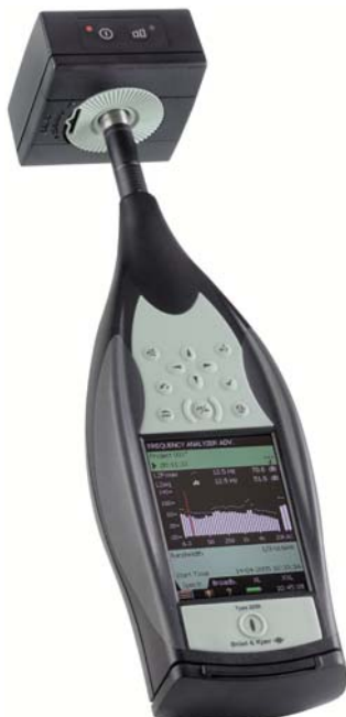
Fig. 2 Tipo 4231 montato sul analizzatore portatile tipo 2250. Il centro di gravità del calibratore viene posizionato molto vicino al microfono, garantendone la stabilità

Posato sul microfono ed attivato (si veda la Fig.2), il calibratore trasmette un livello di pressione sonora continuo.