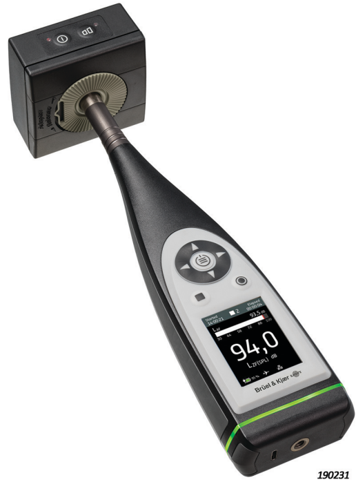
Fig. 2 Tipo 4231 montato sul B&K 2245 Fonometro. Il centro di gravità del calibratore viene posizionato molto vicino al microfono, garantendone la stabilità

Posato sul microfono ed attivato (si veda la Fig. 2), il calibratore trasmette un livello di pressione sonora continuo.