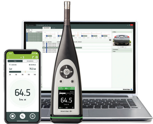
图1 完整的解决方案：B&K 2245 声级计和安装在手机和PC上的 Noise Partner 应用程序

这意味着无需在PC上安装许可证文件，也没有加密狗。移动和桌面应用程序可以免费下载并安装在任何iPhone和PC上，使用嵌入式许可证进行的测量可以通过任何PC上的桌面应用程序进行编辑。